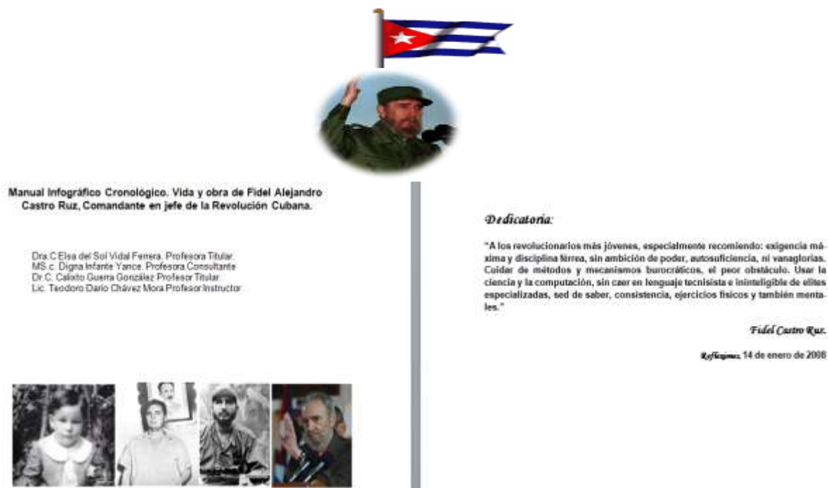
Figura No. 2. Carátula del Manual.

A continuación se muestran las figuras que ofrecen una breve visión del manual.