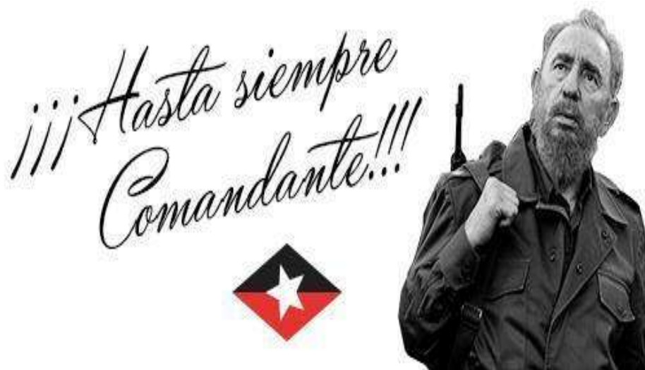
Figura No. 7. Manual Cronológico. "Pensamiento Militar del Comandante Fidel Castro Ruz, como contribución al fortalecimiento de valores".

Cronología de Documentos testimoniales. Relación de 1294 Discursos e intervenciones.