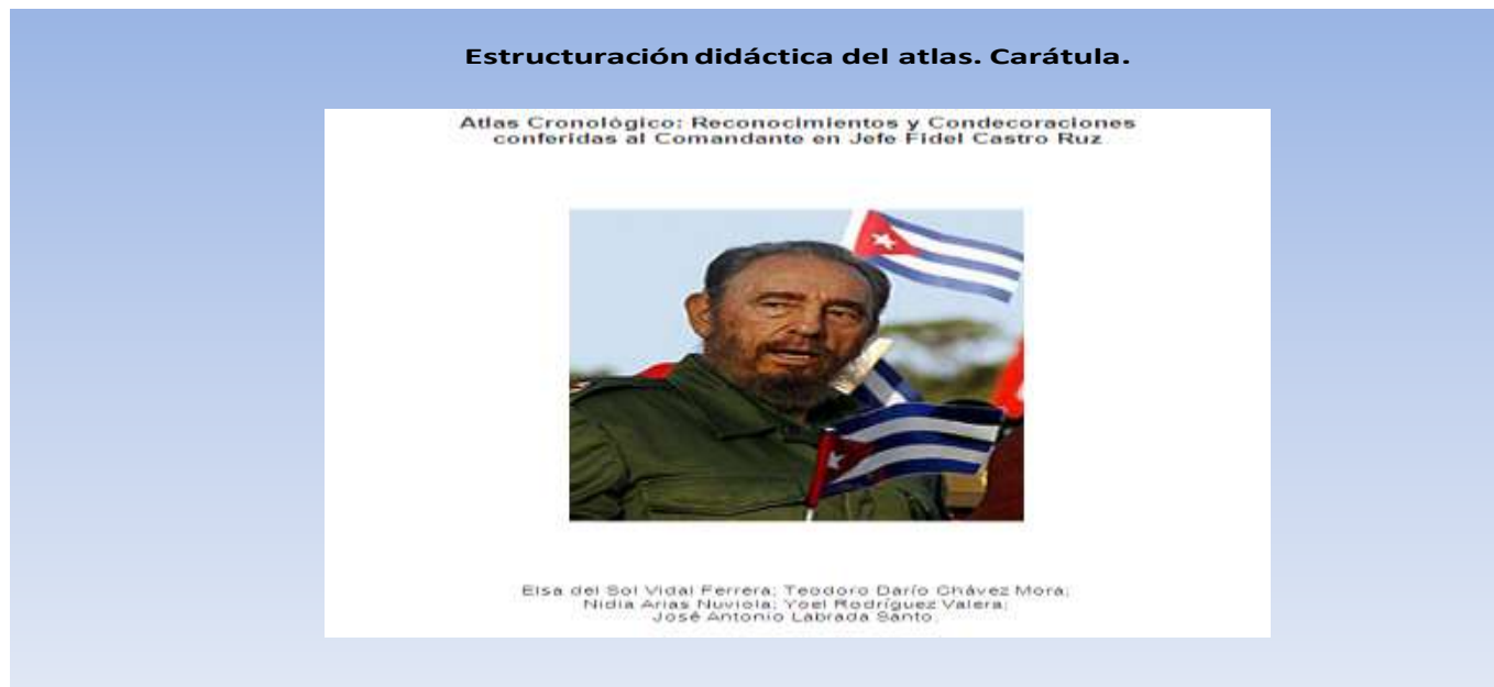
Figura No. 4. Atlas con las 260 condecoraciones y reconocimientos.

Algunas muestras del contenido del Manual Infográfico cronológico. Vida y obra de Fidel Alejandro Castro Ruz.