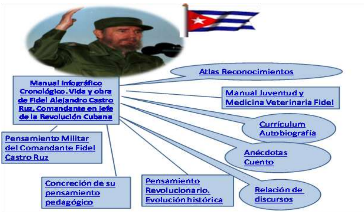
Figura No. 3. Contenido del Manual Infográfico cronológico. Vida y obra de Fidel Alejandro Castro Ruz.