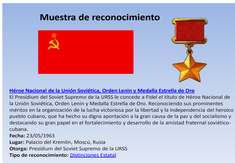
Figura No. 5. Documento del atlas de condecoraciones y reconocimientos.