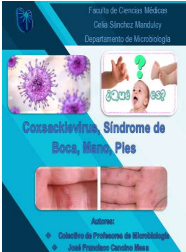
Fig.1 Portada del folleto