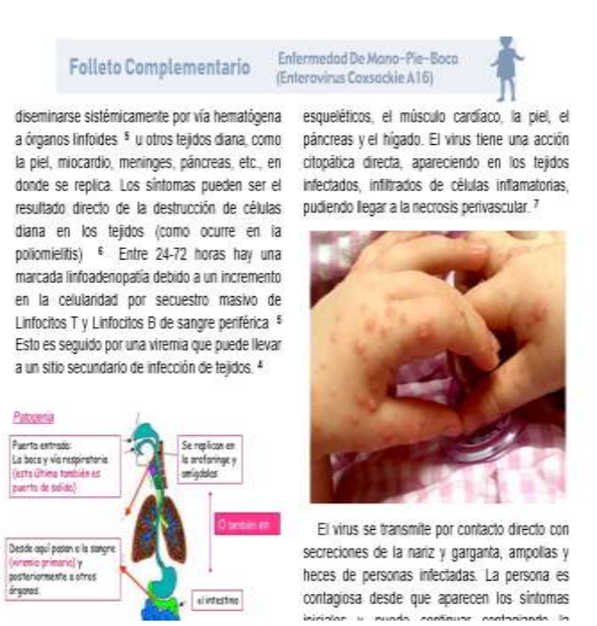
Fig. 3 y 4 Cuerpo del Folleto