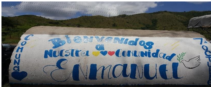
Fig No 3. Identificación de la Comunidad Enmanuel, en el municipio Ezequiel Zamora. Elaboración propia.

Uno de los 18 municipios que forman parte del estado de Aragua, en Venezuela es la comunidad Enmanuel (Fig No 3) que se encuentra en el municipio Ezequiel Zamora, su capital es Villa de Cura. En esta comunidad se desarrolla la cartografía social con el objetivo de identificar los principales problemas sociales y buscar vías de solución.