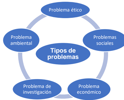
Fig No. 1 Tipos de problemas. Elaboración propia

Para enfrentar un problema se deben buscar técnicas que se emplean para identificar una situación problemática (un problema central) y el árbol de problemas es una técnica utilizada para estos fines, es una herramienta que permite obtener información con una visión simplificada, concreta y ordenada de cada causa (cada raíz del árbol), su impacto (cada rama del árbol) y ponderación en el problema (visualizar qué raíz o rama es la más importante, la que tiene más ramificaciones y cuyos efectos sean determinantes). Es una técnica que puede realizarse en forma individual o grupal. (Betancourt, 2016).