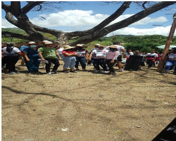
Fig No. 4. Habitantes de la Comunidad Enmanuel en jornadas de trabajo. Elaboración propia.

La integración de los habitantes juega un papel fundamental para el análisis, reflexión y comprensión de los entornos de la comunidad, así como para compartir sus ideas en esta investigación (Fig. No, 4).