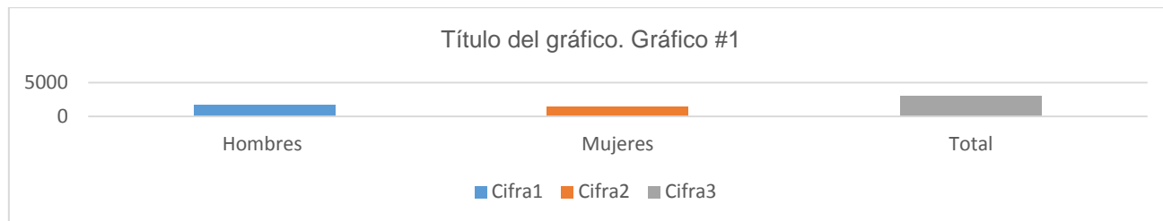
Gráfico # 1. Población de la parroquia rural La América.

El presente trabajo estuvo basado en la investigación de campo, obteniendo la muestra en las comunidades San Bémbe, La América, Tres Divinas, La Tablada, Vargas Torres y Potosí, donde se realizaron encuestas a 10 pobladores de cada comunidad.