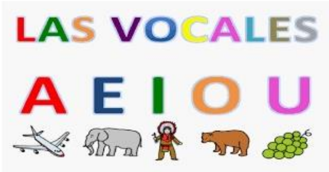
Figura II. Las vocales y su relación con objetos, frutas, animales y seres humanos.

valor significativo, sino que dependen solo de circunstancias fonéticas, y sobre todo, de los sonidos vecinos.