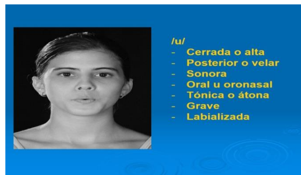
Figura I. Posición de la boca teniendo en cuenta los vocales para el habla.