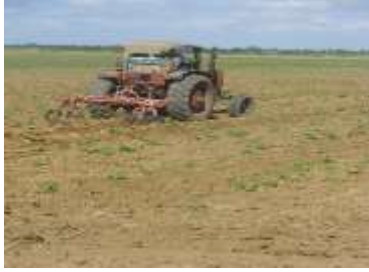
Figura 3. Labor de cultivo entre hilera con grada de discos múltiple BP-206.