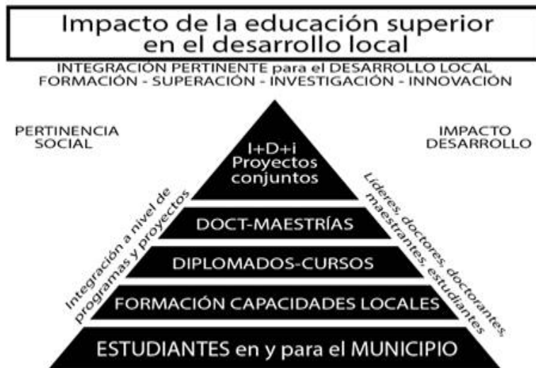
Figura 2. Componentes de impacto de la educación superior en un Sistema de Innovación Local

La universidad debe poner a disposición de los gobiernos todo su potencial científico para contribuir a la capacitación y preparación de los actores locales en la gestión integrada del desarrollo local (figura 2), lo que debe quedar refrendado en el logro de resultados tangibles que permitan la consecución de dos importantes objetivos: pertinencia social e impacto social.