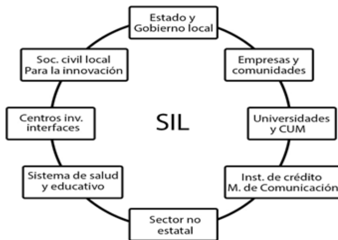
Figura 1. Agentes locales principales en la conformación de un Sistema de Innovación Local a nivel municipal