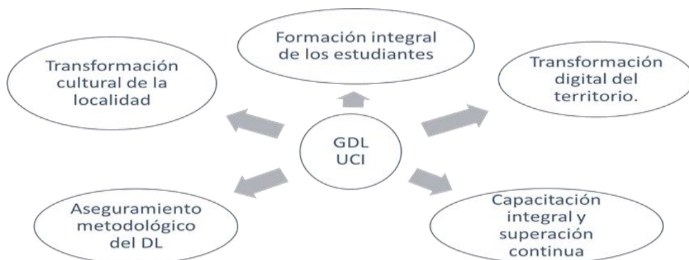
Figura 3. Integración de los procesos universitarios en la gestión del desarrollo local