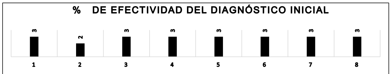
Gráfico # 2.

En el gráfico se muestra el primer control realizado donde la ejecución técnica en cuanto a su efectividad expresa que si la ejecución técnica es de 3 errores por la tabla de tabulación del control se evalúa de regular.